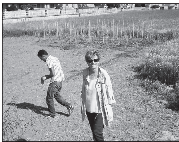
Due immagini dell'appezzamento di terra affidato nell'ambito del progetto “Ortincittà”