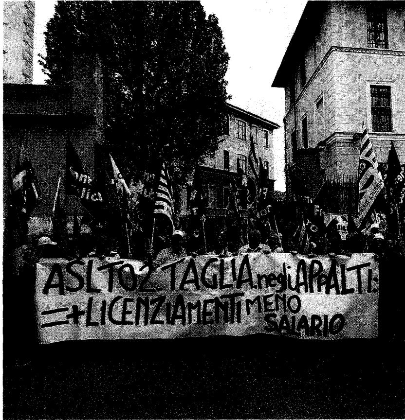
Quasi 4 miliardi sono stati anticipati per pagare i fornitori di beni e servizi di Asl e Regione Nella foto: una manifestazione contro i tagli della Sanità